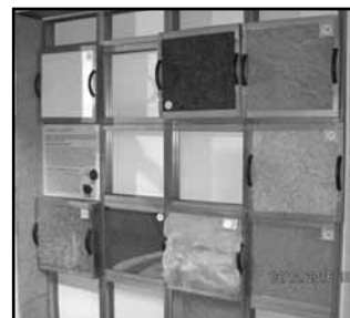
Домът на устойчивата жизнена среда