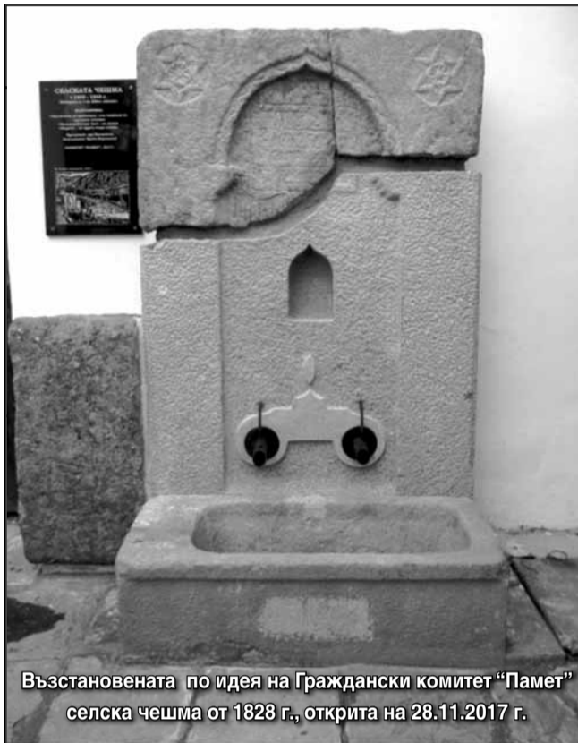
Възстановената по идея на Граждански комитет „Памет“ селска чешма от 1828 г., открита на 28.11.2017 г.

които познават душата на камъка, с може би най-стария занаят на света, а именно занаята на каменоделците. Били са разделени на групи и са едни от най-добрите строители на Балканите. С години са строили сгради в Рим, Венеция, Флоренция, Генуа и др. Няма данни, но някъде там българите строители /дюлгери/ са се докоснали до италианското масонство. И много от тях са станали такива. Там са почерпили от светлината на свободните зидари. Всички тези знания те са пренесли добросъвестно в Москополе и околната, където са живеели техните семейства. Знаели са по няколко езика, донесли са и книги.