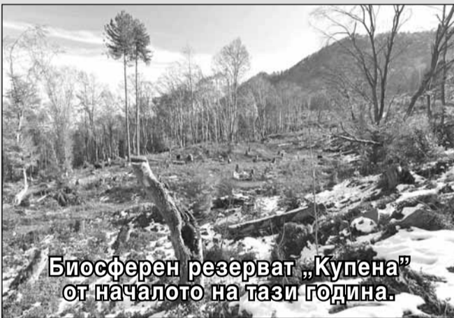
Биосферен резерват „Купена“ от началото на тази година.

Нашите биосферни резервати, обявени по стария ред, имаха определени само сърцевинна и буферна зона, поради което подлежаха на заличаване от списъка на ЮНЕСКО.