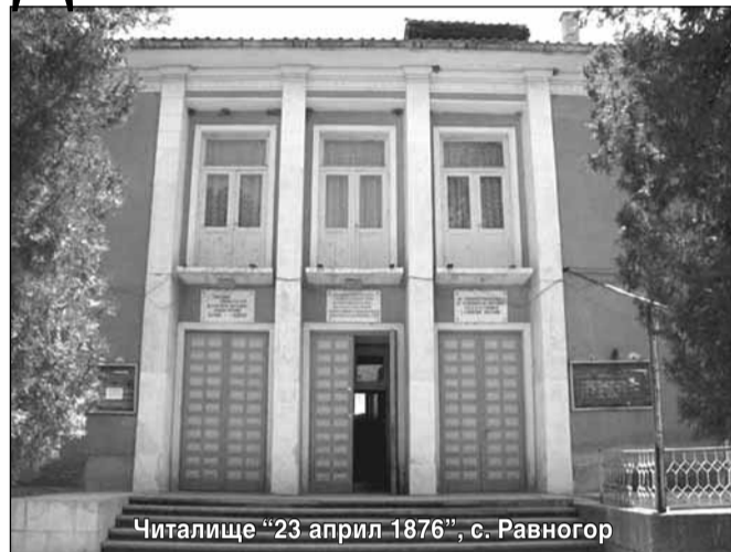
Читалище "23 април 1876", с. Равногор

Правителството одобри допълнителни трансфери в размер на 3 910 954 лв. по бюджетите на общините за целево финансово подпомагане дейността на народните читалища за 2014 година. Средствата са планирани в бюджета и са предназначени за частични ремонти, художествено-творческа