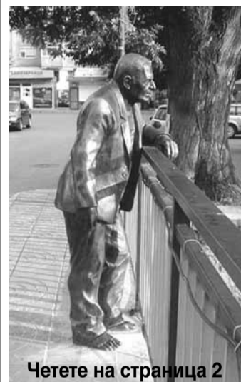
Четете на страница 2

БРАЦИГОВЕЦ Е ЕДИН ОТ ТРИМАТА СКУЛПТОРИ, КОИТО ПРЕВРЪЩАТ КАНАЛА „ПАША АРК“ В ПАЗАРДЖИК В АРТ ПРОСТРАНСТВО