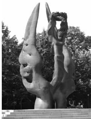
С много жертви, усилия и дипломатичност българите се стремят към желаната цел

В онзи шести ден на месец септември преди 126 години страната ни си възвръща част от онова, което ѝ принадлежи.