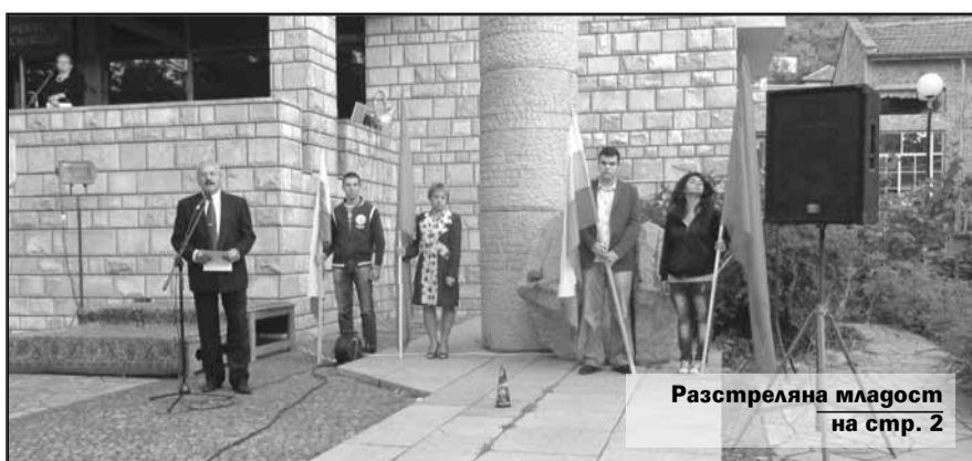
Разстреляна младеж на стр. 2

Симпатизанти и членове на БСП, както и родственици на загиналите сведоха глави в минута мълчание, за да докажат на времето, че никой не