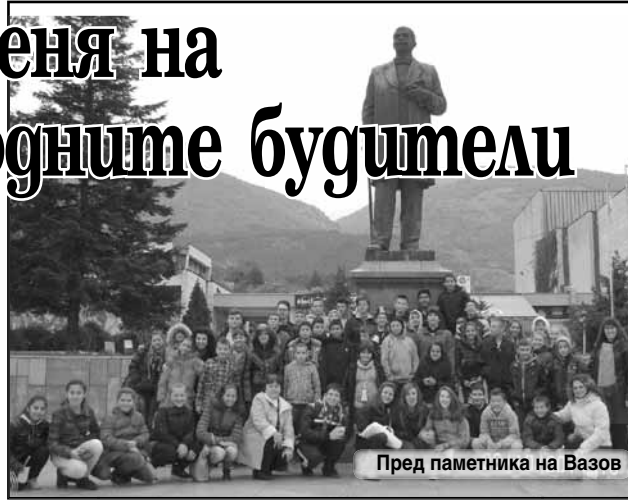
Пред паметника на Вазов