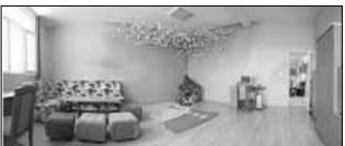
Движението на българските майки - звено Пазарджик

На снимката: „Стая за игра“ в КСУДС - Брацигово. Според легендата, който направи хиляда хартиени жерава, това, за което копнее сърцето му, ще стане реалност.