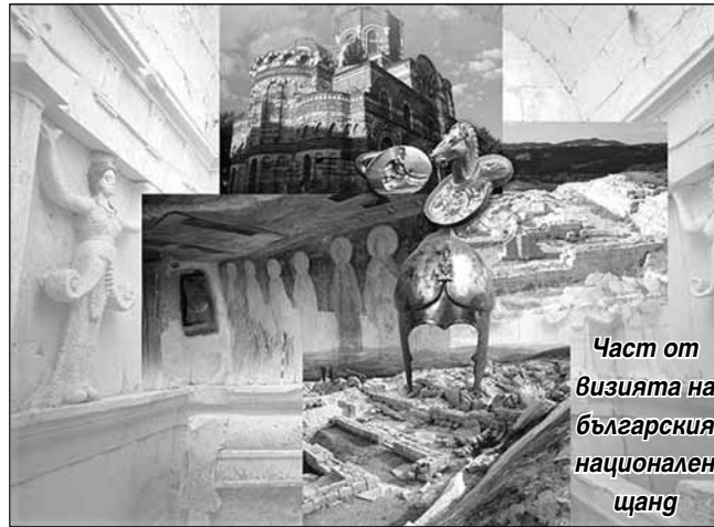
Част от визията на българския национален щанд

дърворезбарско ателие. Предварително изработени и резбовани дървени сувенири бяха подарявани на гостите на щанда. Организирана се демонстрация на занаята през всички дни на изложението. На 6 ноември посетителите се насладиха на изпълнения на български народни танци от фолклорен състав в традиционни носии. Професионален сомлиер проведе дегустации на качествени български вина през цялото време на изложението в специално обособена зона.