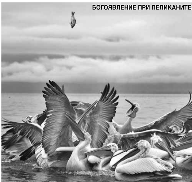
БОГОЯВЛЕНИЕ ПРИ ПЕЛИКАНИТЕ

харесва идеята някой да е положил усилия, а друг да злоупотребава с труда му, макар че точно такава е картинката, която сме свикнали да гледаме в нашата страна. Струва ми време. Най-вече време. А също и средства. Струва ми невидими за другите усилия, ставане рано сутрин, още преди петлите да се разбудят. Струва ми хранене, наблюдение и тър-