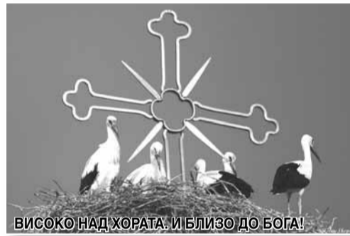
ВИСОКО НАД ХОРАТА. И БЛИЗО ДО БОГА!

На читателите искам да кажа, че има смисъл да бъдеш добър. Има смисъл да преследваш това, за което мечтаеш и с цената на всичко да не спиращ да се бориш за него. Щастие, казват, било в стойността на нещата, които вършиш, но има нещо друго. Има една основа, има една малка частица от Вселената, без която всичко друго губи смисъл – тя е един човек и една любов. Случва се понякога точно когато изгубиш всички запаси от надежда, да я срещнеш. И тази малка частица преобръща и променя живота ти. Кара те да се чувстваш значим, влива живот във вените ти, вярва в теб самия. И това те прави по-добър. Не спиращ да вярваш в любовта, слушайте сърцето си и не убивайте детското в себе си! Поздрав и успехи за всички!