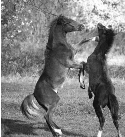
ВЪВ ВИХЪРА НА ТАНЦА

В такъв случай можем ли да считаме, че всеки от нас вече е печен фотограф?