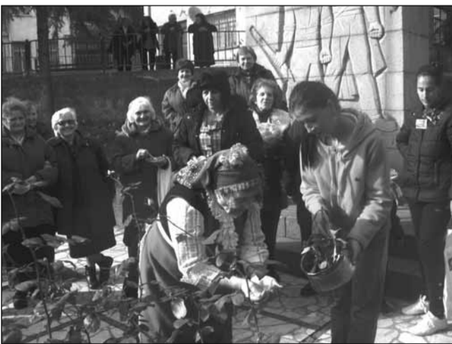
Бабинден в Деня на родилната помощ - 21 януари. И въпреки обезпокояващата тенденция да се раждат все по-малко деца в това спокойно село, празникът се провежда както подобава според народните предания.