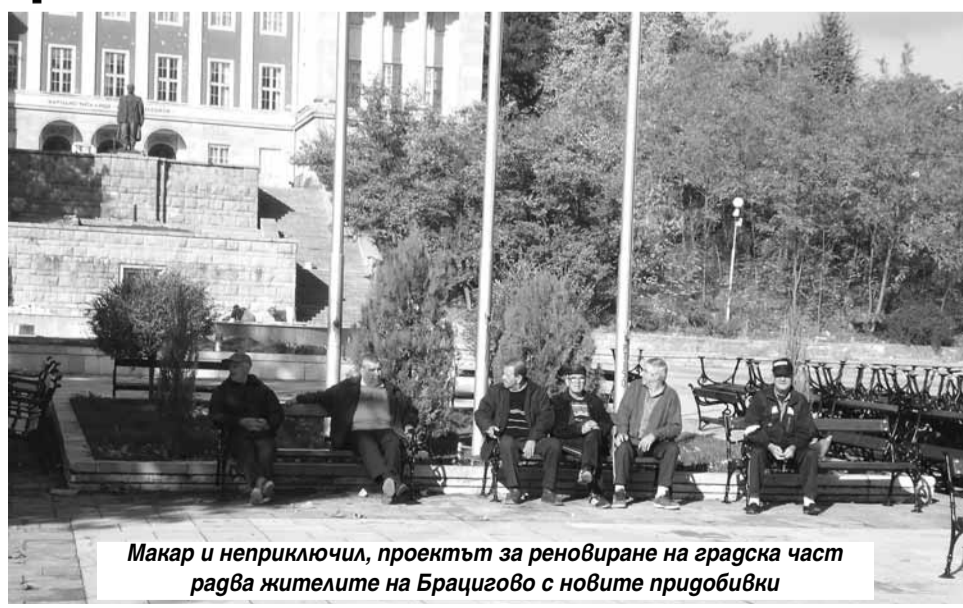
Макар и неприключил, проектът за реновиране на градска част радва жителите на Брацигово с новите придобивки