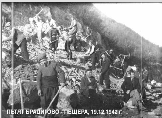
ПЪТЯТ БРАЦИГОВО - ПЕЩЕРА, 19.12.1942 г.