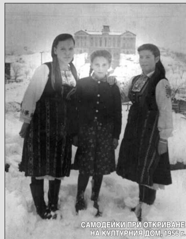
САМОДЕЙКИ ПРИ ОТКРИВАНЕ НА КУЛТУРНИЯ ДОМ, 1956 г.