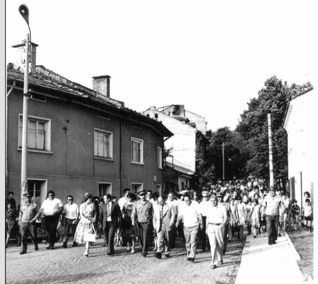
ПОСЕЩЕНИЕ НА ПЪРВИЯ БЪЛГАРСКИ КОСМОНАВТ ГЕОРГИ ИВАНОВ В БРАЦИГОВО

Изложбата е непретенциозна, но изключително ценна. Експонирана е в голямото фоайе на НЧ "В. Петлешков - 1874" и може да се види всеки делничен ден от 9.00 до 17.30 часа.