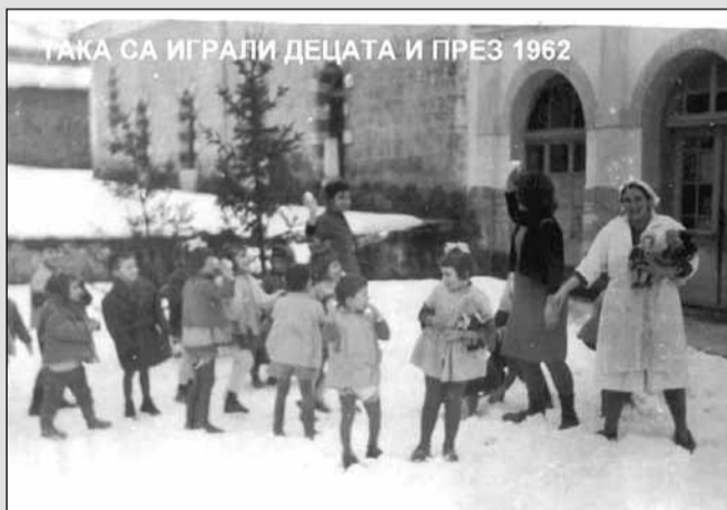
ТАКА СА ИГРАЛИ ДЕЦАТА И ПРЕЗ 1962