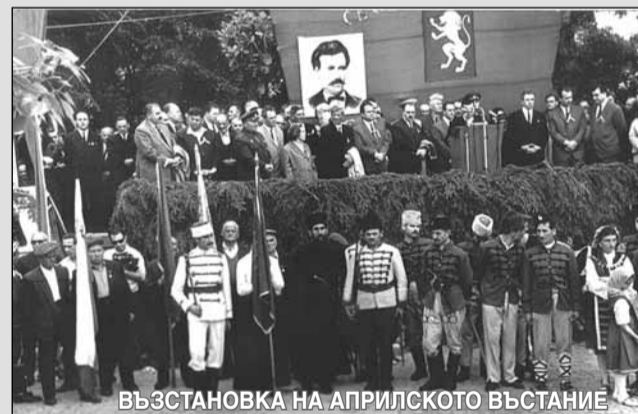
ВЪЗСТАНОВКА НА АПРИЛСКОТО ВЪСТАНИЕ

ОБЩИНСКА ОРГАНИЗАЦИЯ - ГРАД БРАЦИГОВО СЪЮЗ НА ОФИЦЕРИТЕ И СЕРЖАНТИТЕ ОТ ЗАПАСА И РЕЗЕРВА RESERVE OFFICERS AND NONCOMMISSIONED OFFICERS UNION - RONU