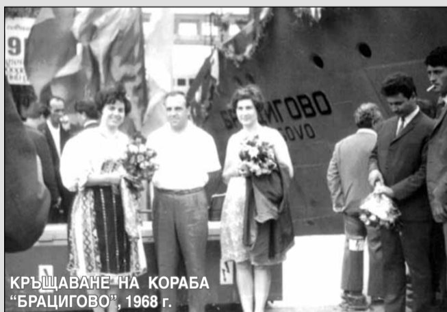
КРЪЩАВАНЕ НА КОРАБА "БРАЦИГОВО", 1968 г.