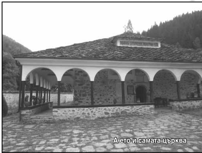
А ето и самата църква

Да, романтиката, с която ни засищат днешните Родопи, е безспорно неописуема. Но дали единствено заради нея някогашните местни жители са избирали за селване най-красивите, но и най-потайните кътчета от