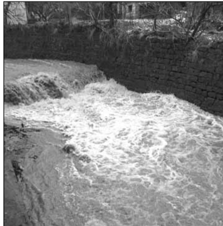
Така изглеждаше иначе тихата и почти безводна река Умишка на 31 януари и 1 февруари 2015 г.

възстановено. В кв. „Банята“ са изкоренени и повалени седем бора, част от които са засегнали покривната конструкция на бивш офис на фирма „Братя Пашкулеви“. Повалени дървета имаше и на кръговото за с. Розово и в двора на фирма „Фида“. В Исперихово реката е излязла от коритото си в участъка на ромския квартал, но щети