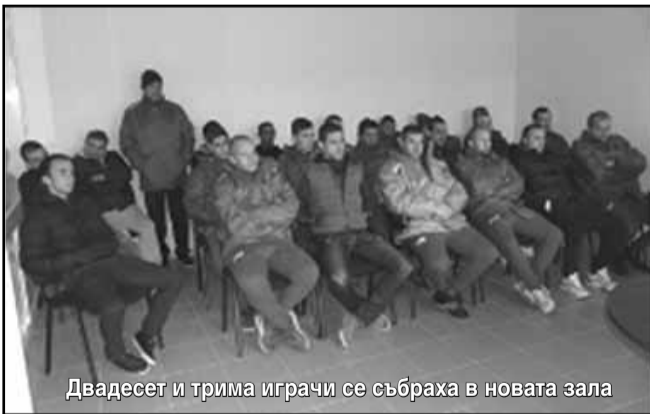
Двадесет и трима играчи се събраха в новата зала