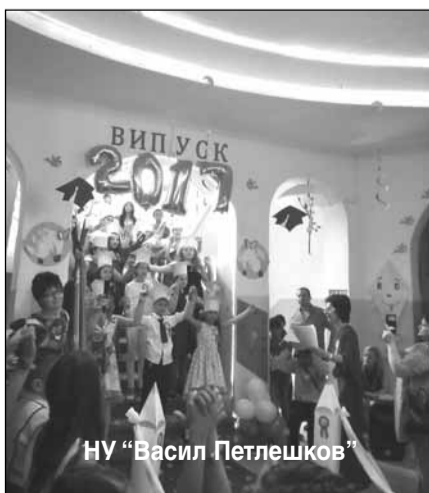
НУ „Васил Петлешков“