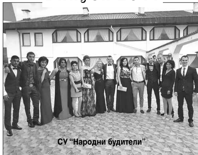
СУ „Народни будители“