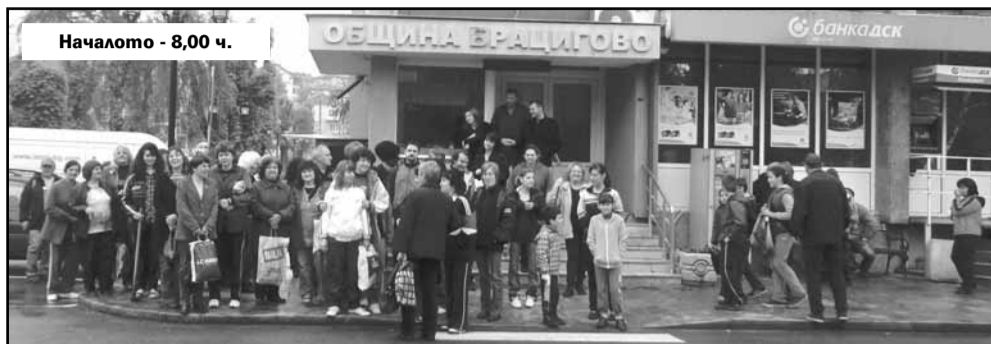
Началото - 8,00 ч.

Почистени са: местността Грамадите, обект Банята, входните и изходните артерии на гр. Брацигово, районите около детски градини и училища, екопътеки, местностите Шипковица, Бальовица, Римски път, Райчов мост, Дялево дере, пътят за с.