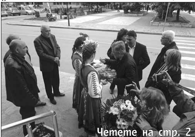
Четете на стр. 2