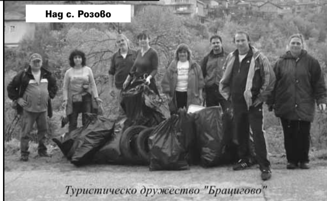
Наг с. Розово